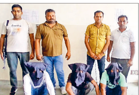
फतेहाबाद। अंकित हत्याकांड में गिरफ्तार दोनों युवक।

बताया कि यह प्रणाली डायल 112 वाहनों की सभी गतिविधियों को रीयल टाइम में ट्रैक करती है। इसमें गश्त की निगरानी, ठहराव का समय, तय मार्ग, रिस्पॉन्स टाइम आदि का विश्लेषण शामिल है। इस तकनीकी से पुलिस की निगरानी क्षमता एवं जवाबदेही में उल्लेखनीय सुधार हुआ है।