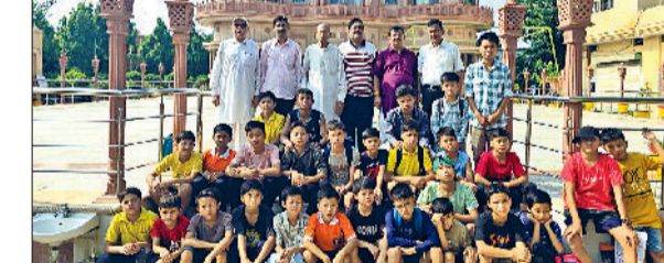
सिरसा। बनवासी कल्याण आश्रम पहुंचा बच्चों का भ्रमण दल।