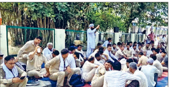
सिरसा। हड़ताल के चलते घरने पर बैठे रोडवेज कर्मचारी तथा सुनसान पड़ा बस अड्डा परिसर।

रोडवेज परिचालक से मारपीट करने का मामला पूरी तरह गरमा गया है। आरोपियों को गिरफ्तारी की मांग को लेकर सिरसा में रोडवेज कर्मचारियों ने चक्का जाम रखा और सरकार के खिलाफ नारेबाजी की। रोडवेज का चक्का जाम होने से जहाँ सवारियों को अपने गंतव्य तक पहुंचने में कठिनाई हुई, वहीं प्राइवेट बस संचालकों व टैक्सी चालकों ने हड़ताल का खूब लाभ उठाया। हालांकि हिसार-फतेहाबाद व सिरसा डिपो को छोड़कर अन्य डिपुओ से बसें सिरसा पहुंची, लेकिन हड़ताली कर्मचारियों ने उन्हें बस अड्डा में जाने से रोक दिया। कुछ दूरी पर ही बसें रुकीं और यहां से सवारियां भरकर अपने रूटों पर चली। चक्का जाम रहने से रोडवेज विभाग को राजस्व का भी नुकसान हुआ है। हड़ताल कर्मचारियों ने सरकार को चेतावनी दी है कि यदि शीघ्र ही हमलावरों को गिरफ्तार नहीं किया गया तो साझा मोर्चा प्रदेश स्तर पर रोडवेज का चक्का जाम करेगा। रोडवेज की हड़ताल के चलते दिल्ली की तरफ जाने वाले यात्रियों ने रेल का सहारा लिया और अपने गंतव्य तक पहुंचे।