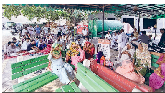
फतेहाबाद। नगरपरिषद में धरना देते कर्मचारी।

नगरपरिषद में मुख्य सफाई निरीक्षक यानि सीएसआई द्वारा बीते दिनों नगरपरिषद के सफाई कर्मचारियों को भला-बुरा कहने के बाद माफी मांगनी पड़ी थी, इसके बावजूद भी वह अपनी हरकतों से बाज नहीं आ रहा। वीरवार को सीएसआई ने फिर सफाई कर्मचारियों को उकसाते हुए